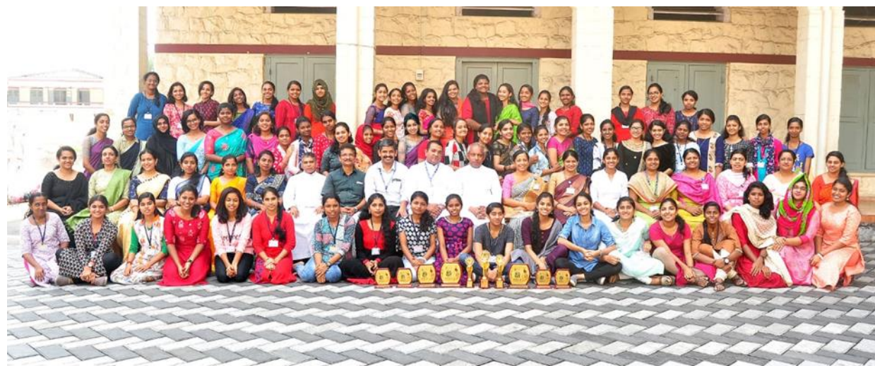
Participants with the Principal & the Manager