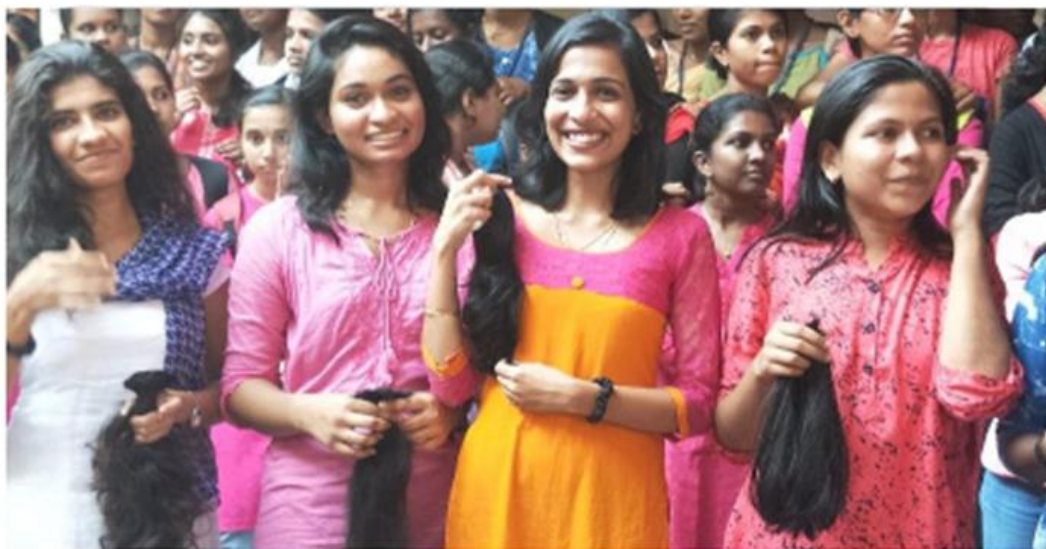
Protect Your Mom is a cancer awareness campaign that educates women towards regular screening and early detection to find and conquer cancer through kids.

Published: November 22, 2018 03:19 PM IST