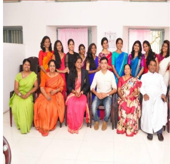
College Union and Arts Club Inauguration