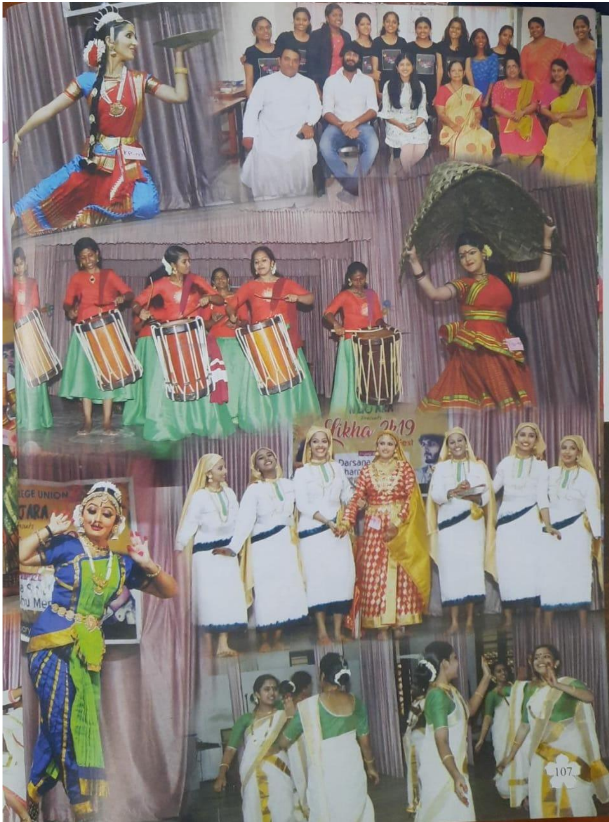
Arts Festival Likha 2019