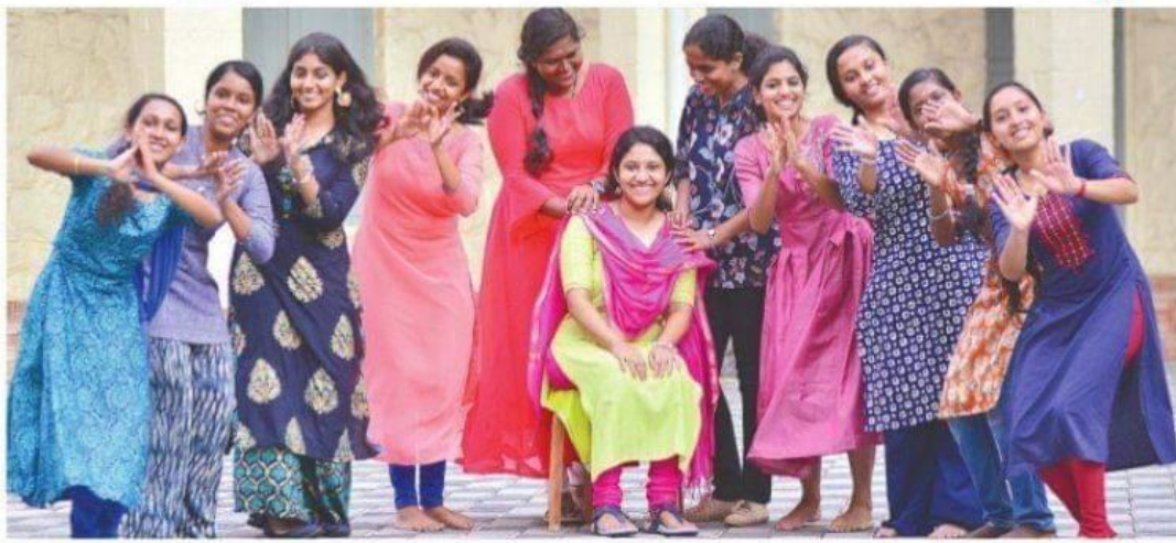
ഇന്ന് ആരംഭിക്കുന്ന എംജി സർവകലാശാല കലോത്സവം 'അലത്താള'ത്തിനു മുന്നോടിയായി ബിസിഎം കോളജ് വിദ്യാർത്ഥിനികൾ ഒപ്പന പരിശീലനത്തിൽ.