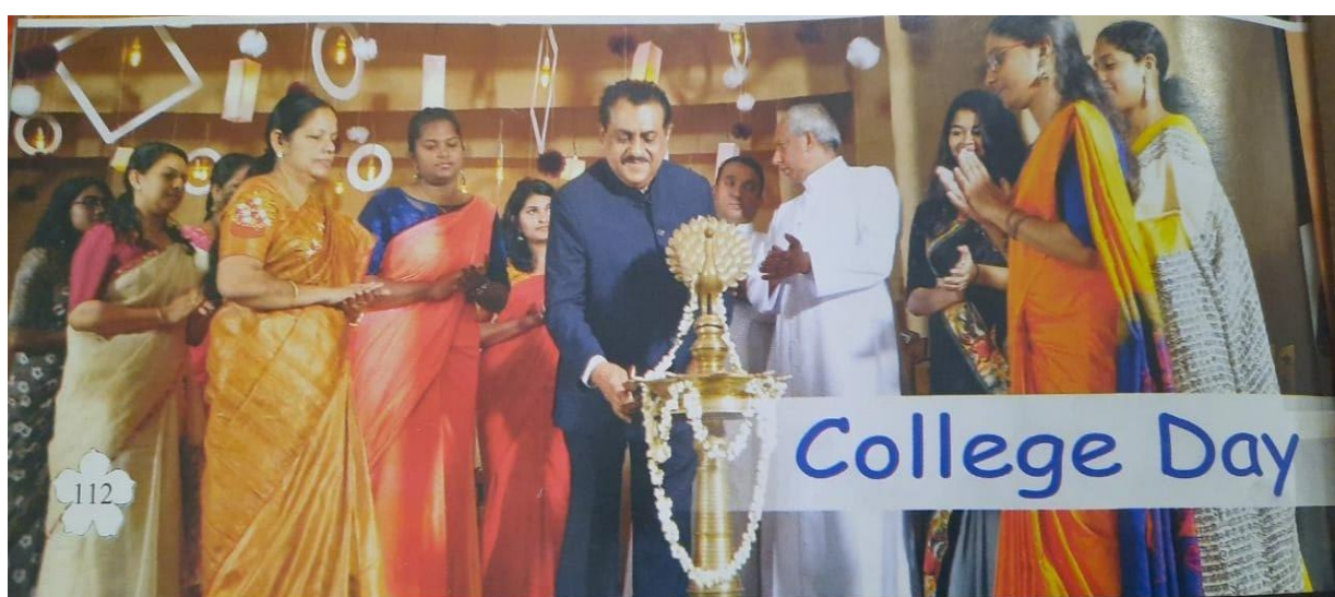
College Day Celebration by Justice J.B Koshy