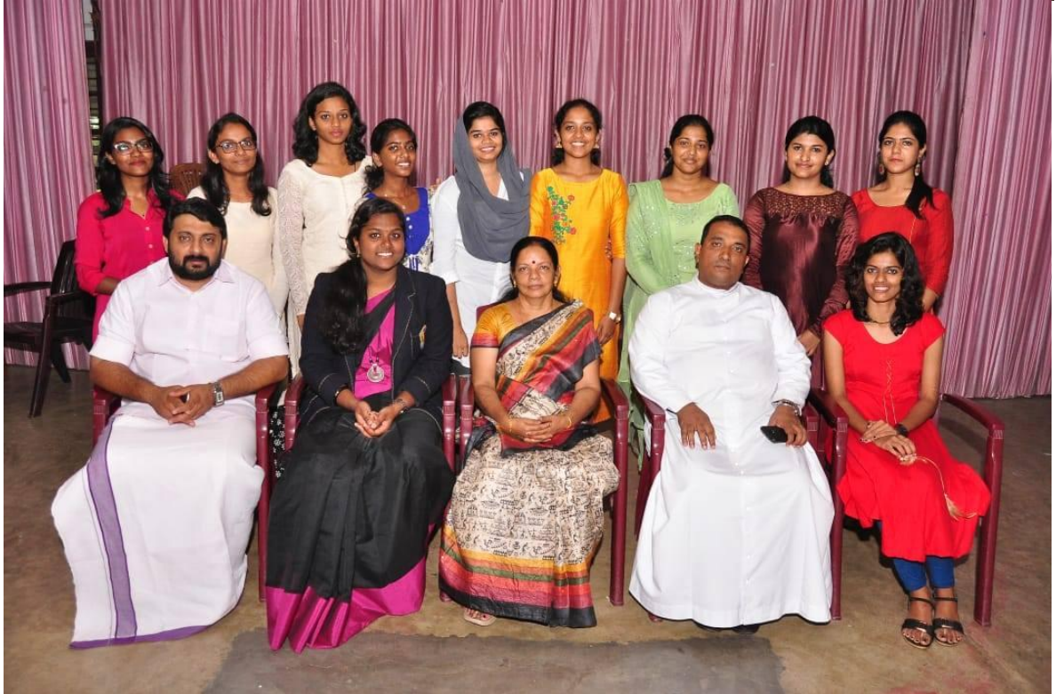
Oath Taking Ceremony