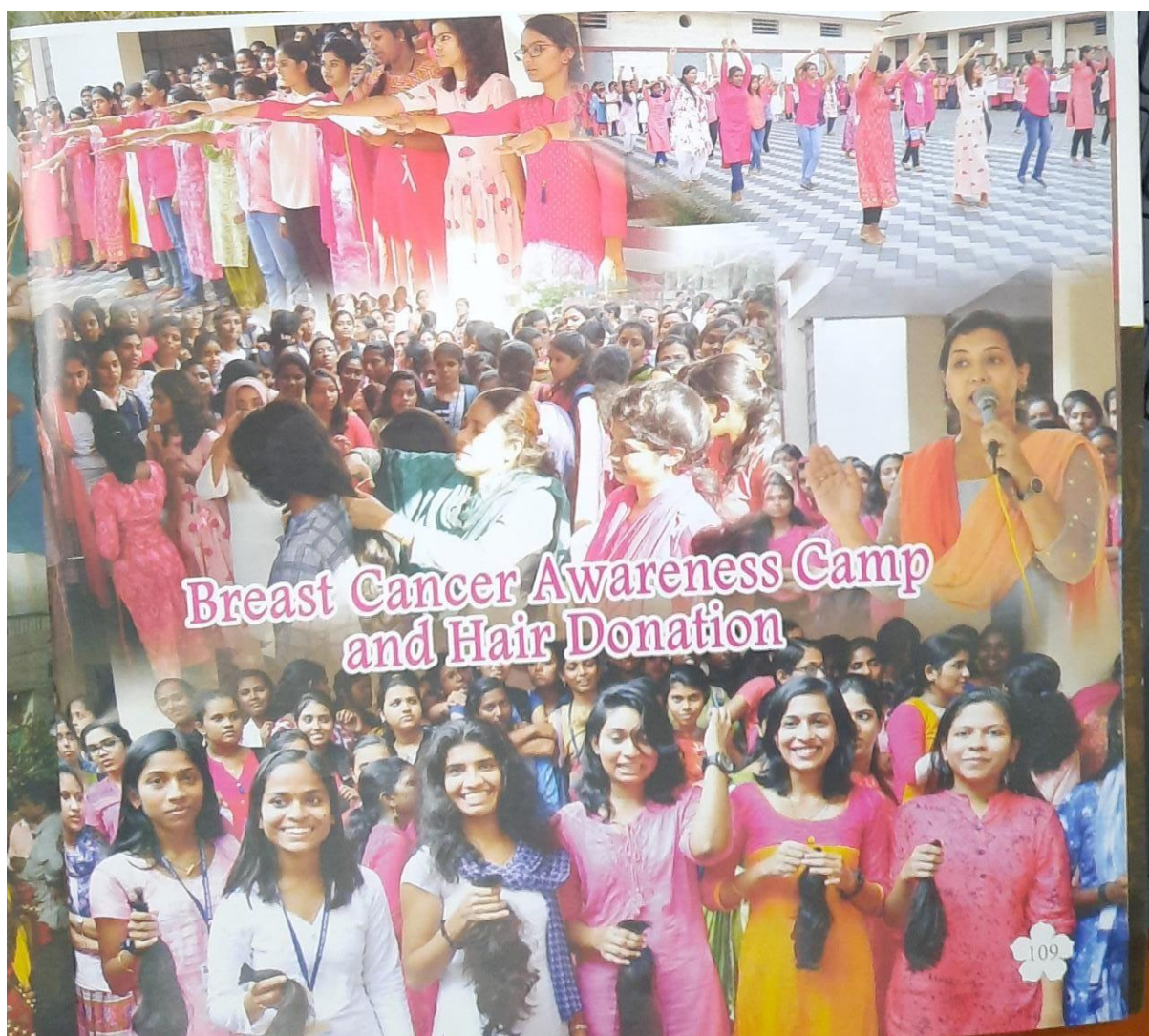
Breast Cancer Awareness Camp and Hair Donation