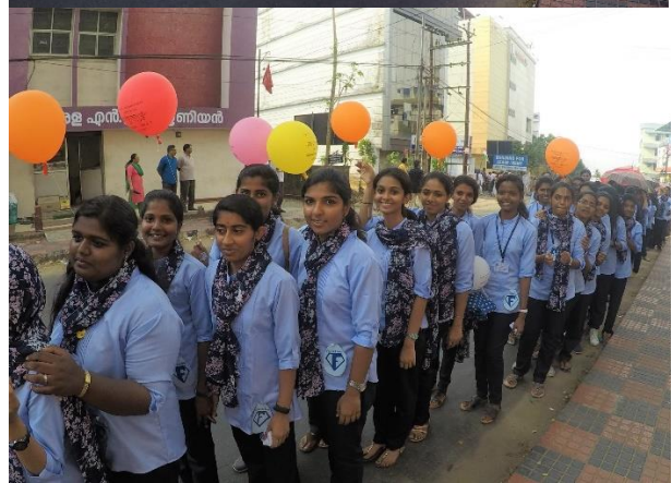
BCM @ Kalolsavam Rally at Kottayam